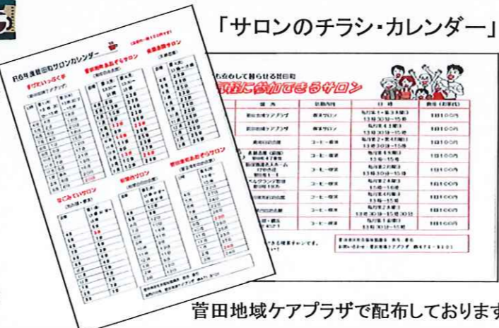
菅田地域ケアプラザで配布しております！