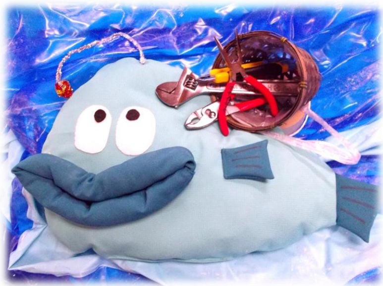
菅田安心ボランティア マスコットキャラクター あんぼら（安ボラ）くん

『菅田安心ボランティア』は、草刈り、障子の張替え、電球の交換など、 おうちの中のちょっとした困りごと の解決をお手伝いします。